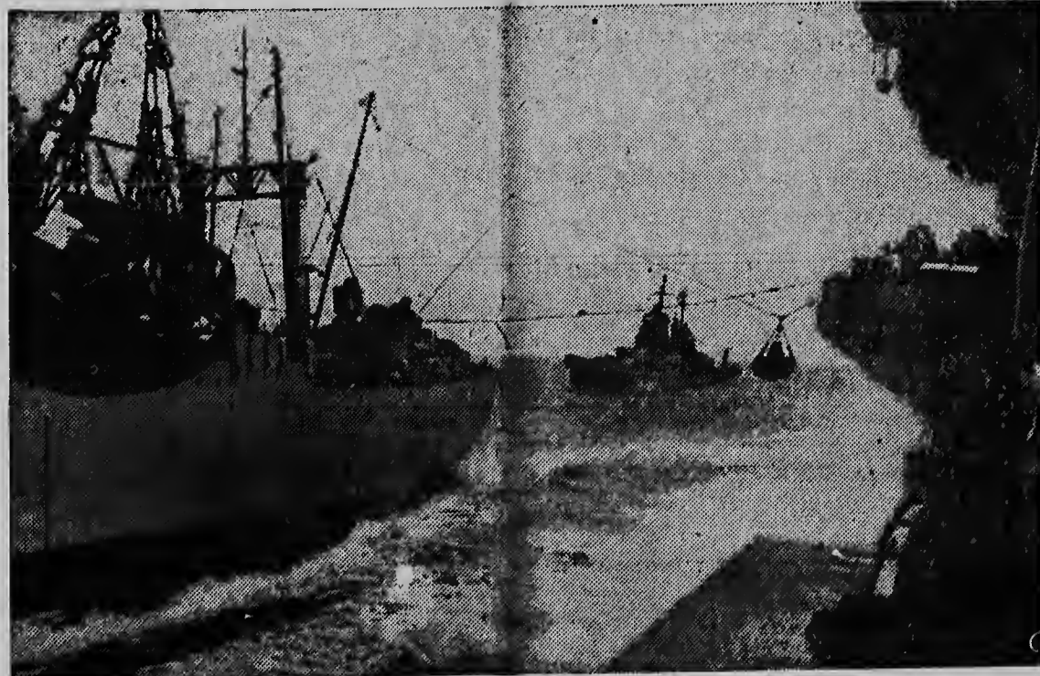
SHIPS OF THE U.S. SEVENTH FLEET, patrolling Far Eastern waters around the Nationalist China stronghold of Formosa, are shown receiving supplies from the Aludra (left). The aircraft carrier Hornet (right) is being provisioned as the fleet flagship, the heavy cruiser St. Paul (background), moves into position awaiting its turn. Russia has charged that use of these ships in the vital area constitutes United States aggression against Red China. The U.N. has postponed considering the matter.

Ook de definitieve uitslag in het Huis van Afgevaardigden is nog niet bekend. Het ziet er ech- ter naar uit, dat de Democraten 233 zetels zullen bezetten van de 435 en de Republikeinen 202.